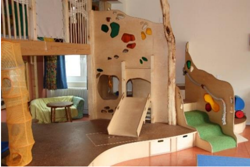
Spielebene in der Nestgruppe